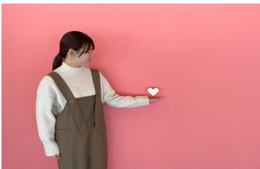
浮かぶ白いハート