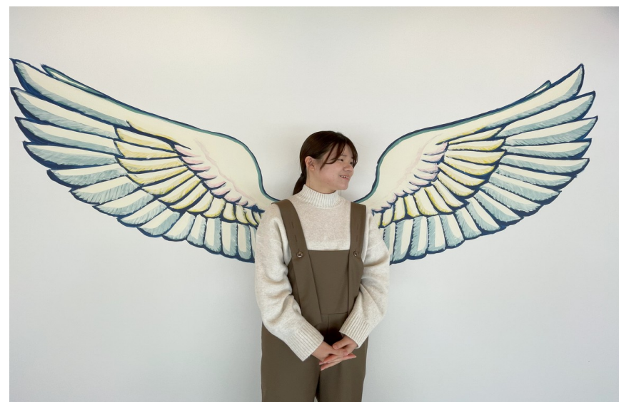
カラフルな天使の羽