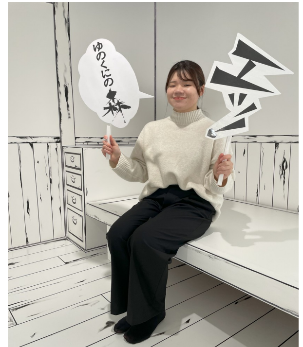
吹き出しもご用意しています