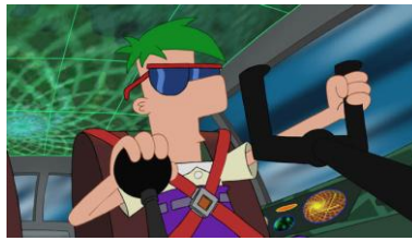
#33 『ミーブの隠された真実』