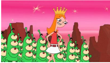
#23 『科学発表会／科学発表会番外編』

特別編成「スター・ウォーズ大放送 ディズニー・チャンネル 宇宙でキマリだ！サタデー」 「フィニアスとファーブ」の宇宙に関連したエピソードを連続放送 10月25日(土)14:30~17:30