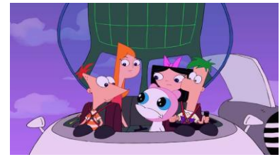
#92 『ミーブにめぐり逢えたら』

■特別編成「スター・ウォーズ大放送 ディズニー・チャンネル 宇宙でキマリだ！サタデー」