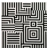
ヴィクトル・ヴァザルリ