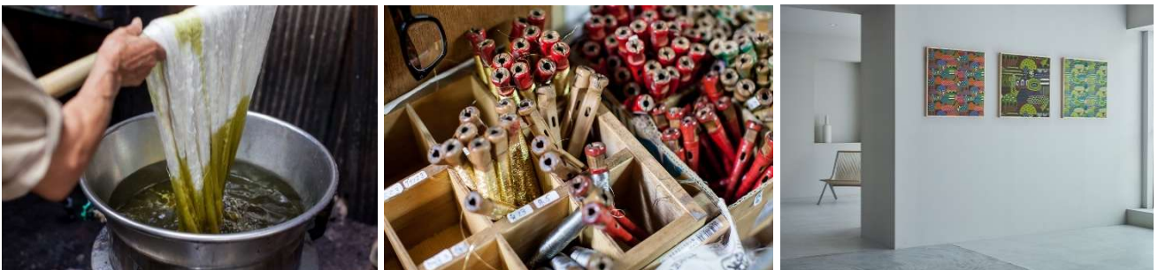
第一弾《光る山》制作の様子と作品

《TEXTILE ART COLLECTION》は、「Heartart」の理念を継承し、2023年に始まりました。テキスタイルは、衣服やカーテン、寝具など、暮らしに欠かせない存在である一方で、日本各地にはまだ広く知られていない布の作り手や、織り・染めといった優れた技術が数多く存在しています。フジエテキスタイルではそれらに着目し、テキスタイルの可能性や楽しさを伝えるべく、本コレクションを企画・開発しています。空間を彩るアートとしてのテキスタイルは、より自由で多様な表現を可能にします。