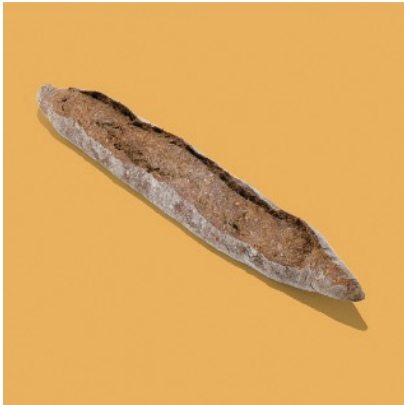
紅抹茶のバゲット