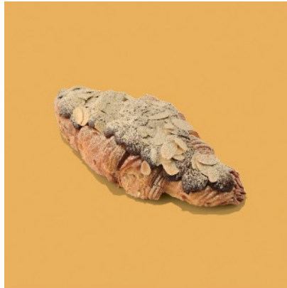
紅抹茶クロワッサン・オ・ダイヤモンド