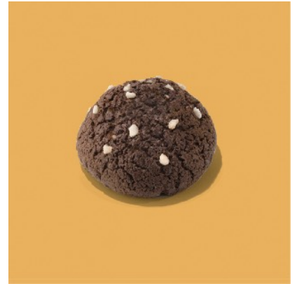
紅抹茶パン・メロン