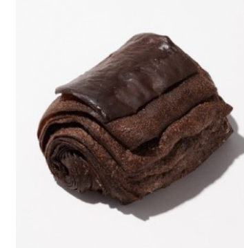
ブラックパンオショコラ ¥395

ココア入りヴィエノワ生地にクランベリーとチョコチップを合わせて焼き上げチョコクリームを絞りました。