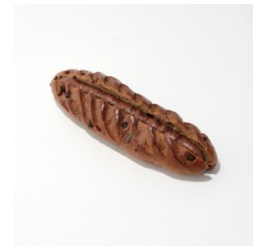
チョコチップヴィエノワショコラ ¥389

トラディション生地にブラックココアを練りこみ、2種類のチョコを巻き込み焼き上げました。