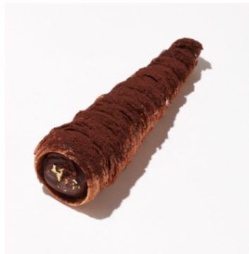
クロワッサンコロネ 生チョコ ¥432