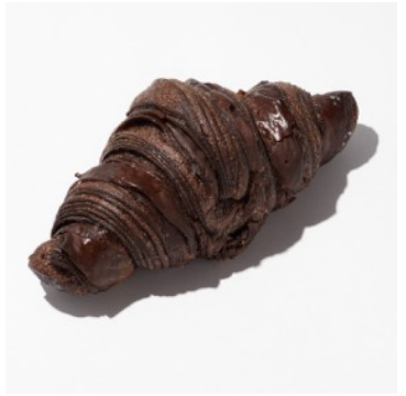
ブラックチョコクロワッサン ¥389

香り豊かなパイ生地の中に、芳醇なピスタチオダイヤモンドと甘酸っぱいラズベリージャムを丁寧に挟み込んだ特製アーモンドクリームを包み込み、風味とコクが織りなす贅沢なひとときを演出。