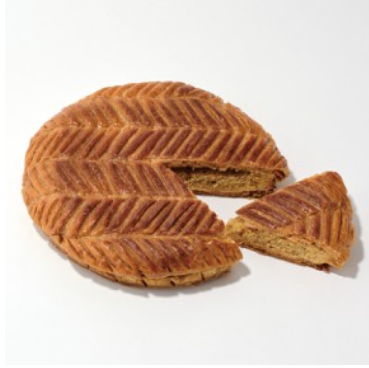
ガレット・デ・ロワ プレーン (ホール) ¥2,268