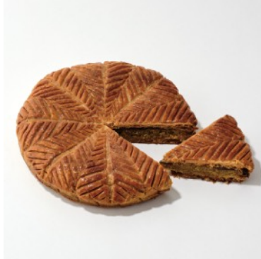
ガレット・デ・ロワ ピスタチオ (ホール) ¥2,592

オレンジリキュールとラム酒で香り豊かに仕上げたアーモンドクリームをバター香るリッチなパイ生地であっふりと包みました。