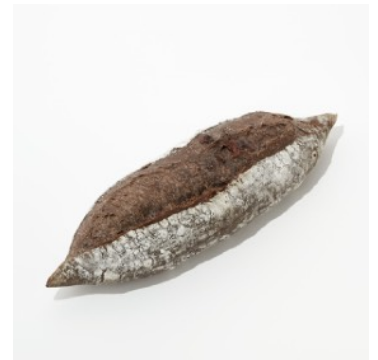
ショコラバゲット ¥292

トラディション生地にブラックココアを練りこみ、2種類のチョコを巻き込み焼き上げました。