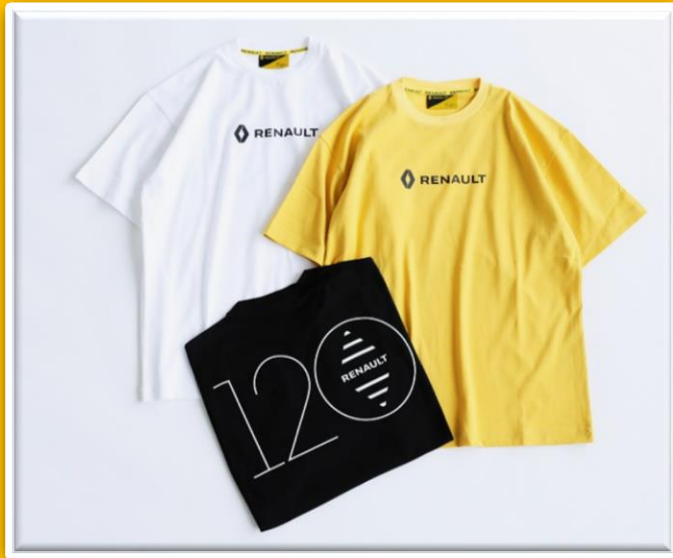
120 th LOGO Tsh ¥5,800- size / M, L col / WHITE, BLACK, YELLOW

RENAULT 120周年を記念してフランス人グラフィックデザイナーが手掛けたLOGOを背中にプリントした1枚。