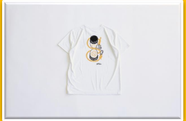
HUGO YOSHIKAWA GRAPHIC T-sh / ¥5,900- / size M, L / col WHITE