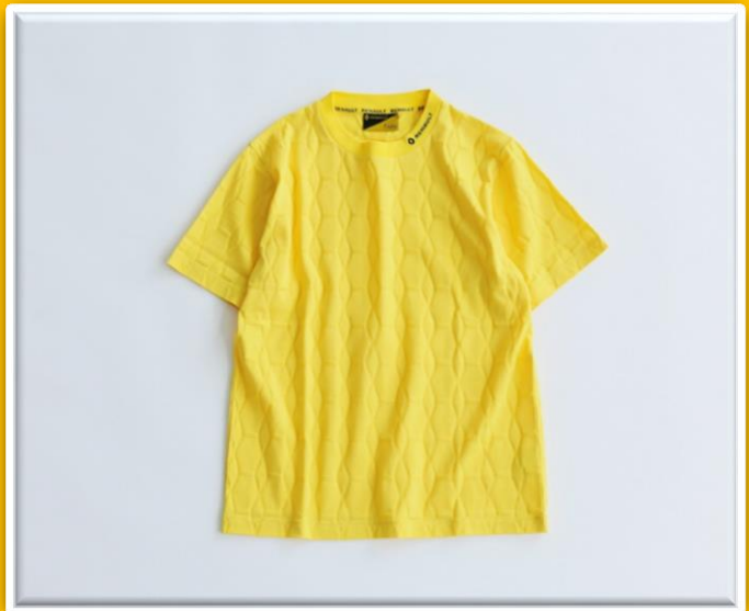
BIG EMBLEM Tsh ¥5,800- size / M, L col / WHITE, BLACK, YELLOW

RENAULTのロゴを大胆にデザインした表現した1枚。このエンブレムは「ロザンジュ」と呼ばれている。これはルノー車の品質の高さやダイナミズムを表している。因みに現在のエンブレムを2004年より使用されている。