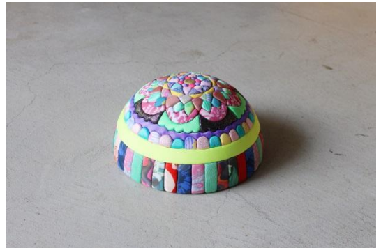
立体曼陀羅① 250×250×125mm ¥ 35,000+tax