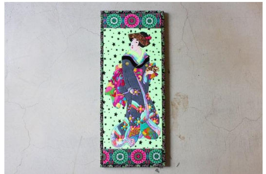
はんなりと 912×377×24mm ¥ 120,000+tax