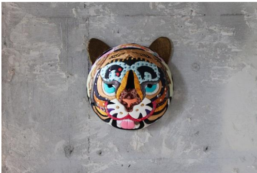
寅丸 250×250×125mm ¥ 35,000+tax