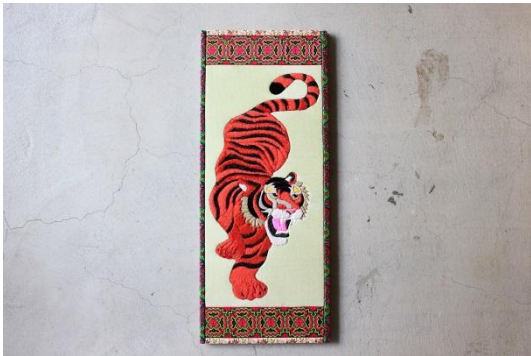
黄虎 912×377×24mm ¥ 120,000+tax