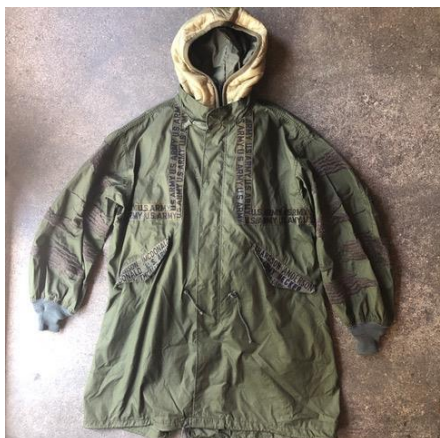
D-65 ¥70000+tax ※ベスト付属 COL. KHAKI SIZE.FREE