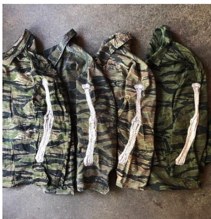
BORN TO BE WILD ¥28000+tax COL. TIGER SIZE.FREE