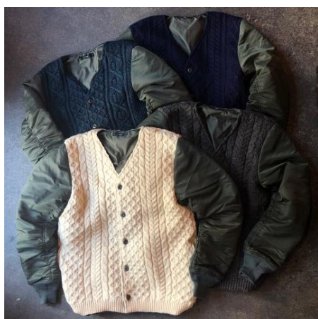
CARDIGAN JACKET ¥43000+tax COL. ASSORT SIZE.M.L