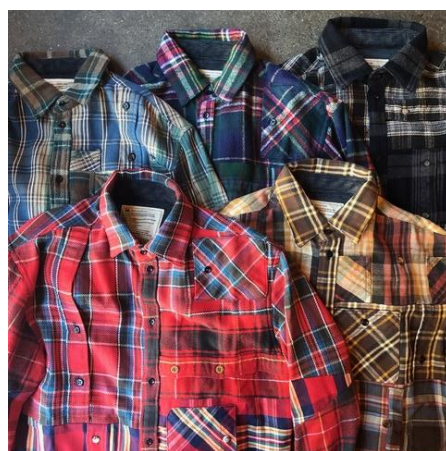
PATCHWORK SHIRTS ¥32000+tax COL. ASSORT SIZE.M.L

大阪発のリメイクブランド「ink」が、今回のリニューアルオープンのために特別に作成した数量限定アイテムを展開。