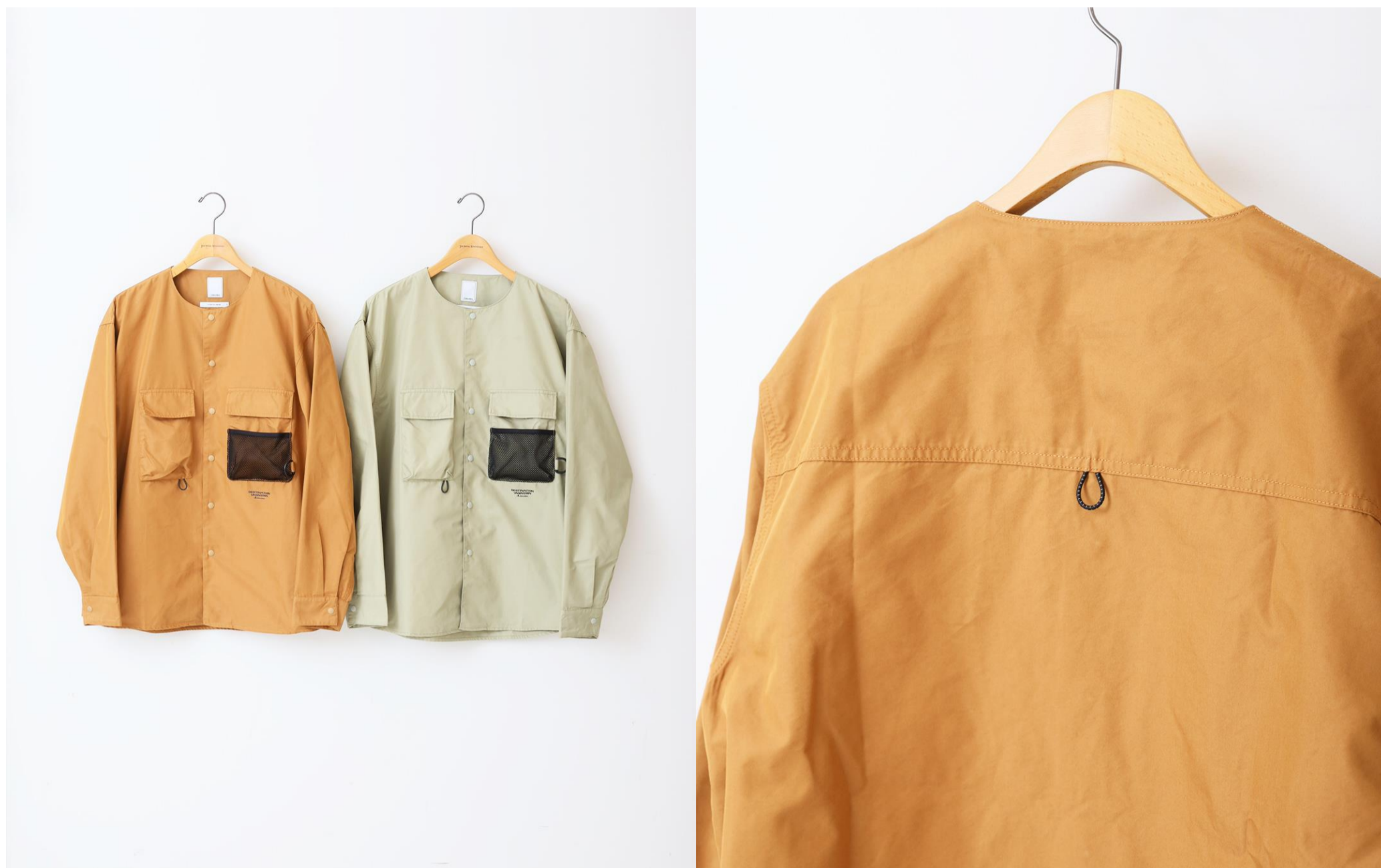
Liberaiders × JOURNAL STANDARD / ユーティリティシャツ/¥18,700税込