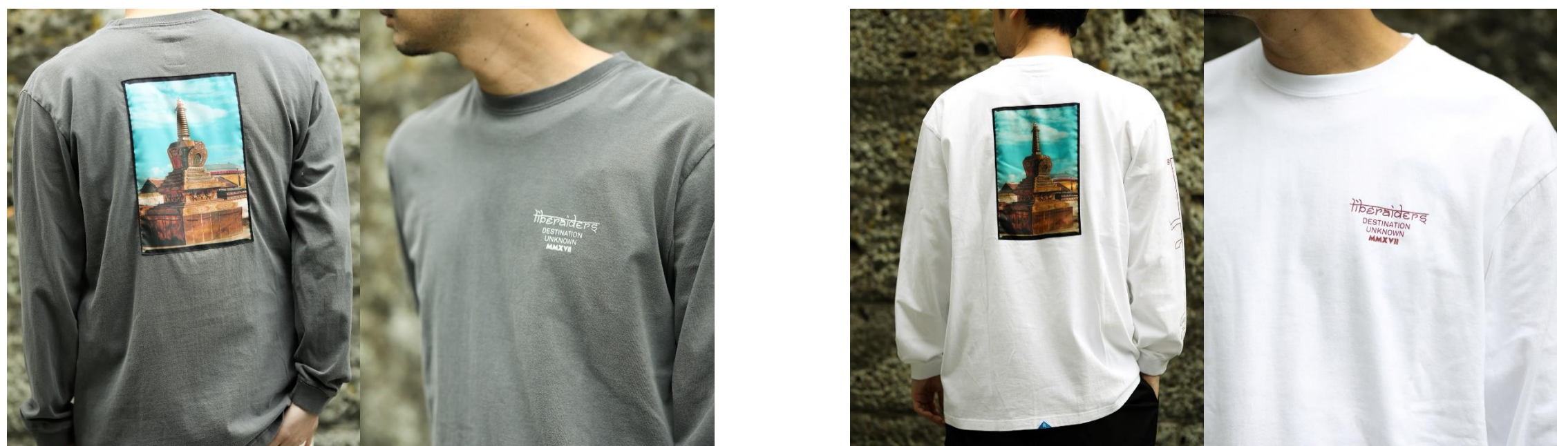
Liberaiders × JOURNAL STANDARD / MAW ロングスリーブTシャツ/¥8,800税込