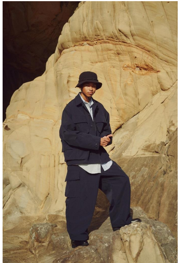
JUNGLE FATIGUE JACKET/¥31900- 6P PANTS/¥25300-