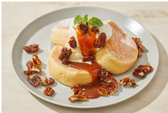
奇跡のパンケーキ ゲランドの塩キャラメルバター 1,100円 (税込1,210円)

ローストしたピスタチオを混ぜ込んだピスタチオアイスと濃厚 ピスタチオペーストをたっぷり使用したクリームが主役の贅沢 パンケーキ。ナッツの女王『ピスタチオ』を思う存分楽しんで。