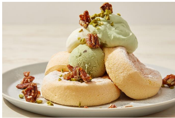
奇跡のパンケーキ ローストピスタチオとキャラメルナッツ 1,350円 (税込1,485円)

レモンピール入りのソルベとチーズクリームに自家製の レモンカードをたっぷりかけた爽やかなパンケーキ。 ワッフルシュガーのシャリシャリ感をお楽しみ下さい。