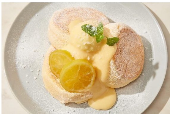
奇跡のパンケーキ 3種のレモンとレアチーズ 1,100円 (税込1,210円)

レモンピール入りのソルベとチーズクリームに自家製の レモンカードをたっぷりかけた爽やかなパンケーキ。 ワッフルシュガーのシャリシャリ感をお楽しみ下さい。