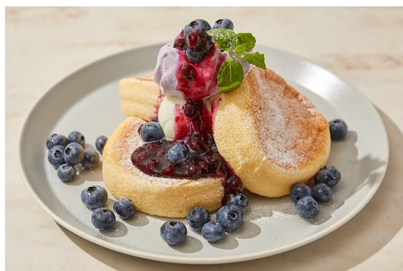
奇跡のパンケーキ ハニーブルーベリーヨーグルト 1,200円 (税込1,320円)

ゲランドの塩を使用した自家製のほろ苦い塩バターキャラ メルソースと濃厚バニラアイスを合わせたパンケーキ。 キャラメリゼしたピーカンナッツがアクセント。