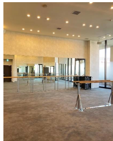
※画像は CARDIO BARRE fit 横浜店