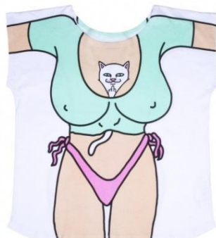
Guzungas Beach Tee ¥5,500 +tax