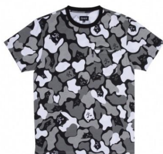
Blizzard Camo Tee ¥5,500 +tax