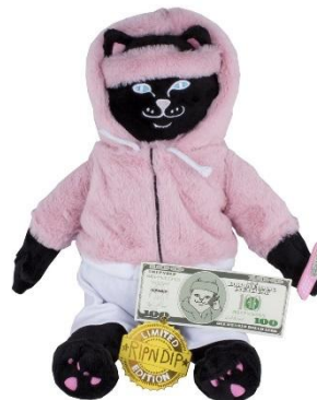
Killa Jerm Plush Doll ¥6,000 +tax