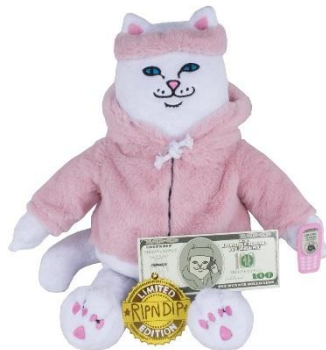
Killa Nerm Plush Doll ¥6,000 +tax