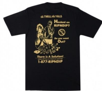
Hooked Tee ¥5,000 +tax