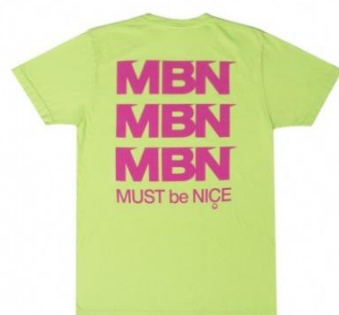
Ripp De Dipp ¥5,000 + tax