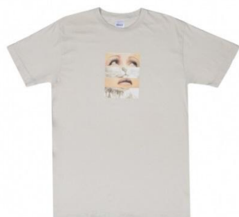
Pussy Face Tee ¥5,000 +tax