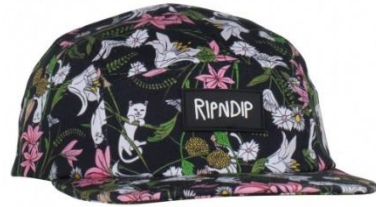
Nerm Flower 5 Panel ¥6,000 +tax