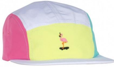
Beaches 5 Panel ¥6,000 +tax