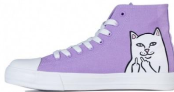
Nerm High ¥11,000 +tax