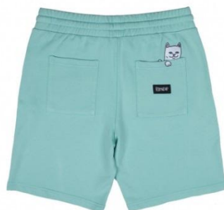
Peek A Nerm Over Dye Sweat Short ¥9,000 +tax