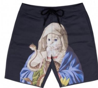
Venom Swim Shorts ¥8,000 +tax