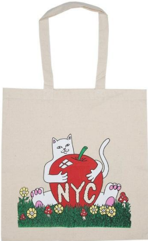
New York Tote Bag ¥3,000 +tax