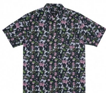
Nerm Flower Button Up ¥9,000 +tax