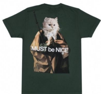
Nermus Tee ¥5,000 +tax