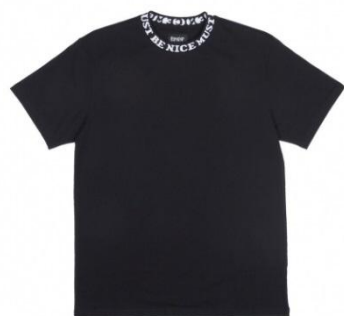
MBN Jacquard Rib Tee ¥5,200 +tax