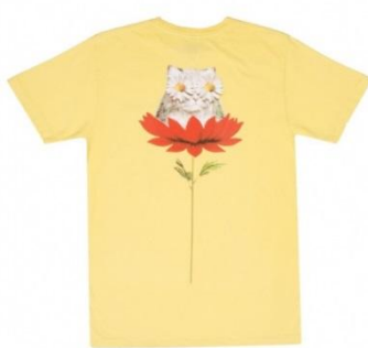
Daisy Do Tee ¥5,000 +tax