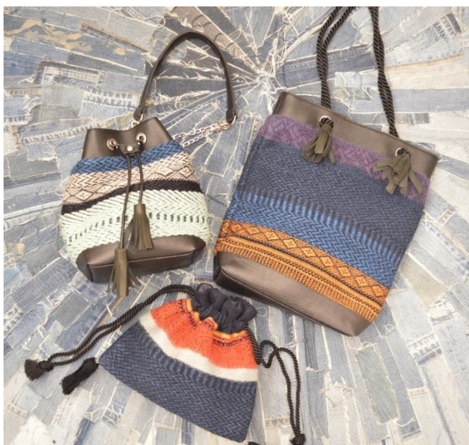
BONUM*FAD distortion 別注バッグ

手動の家庭用ニット編み機で作り出す、オリジナルのテキスタイルを使ったバッグブランド「FAD distortion」。今回BONUMは、コラボレーションバッグのリリースに併せてPOP UPイベントを行います。