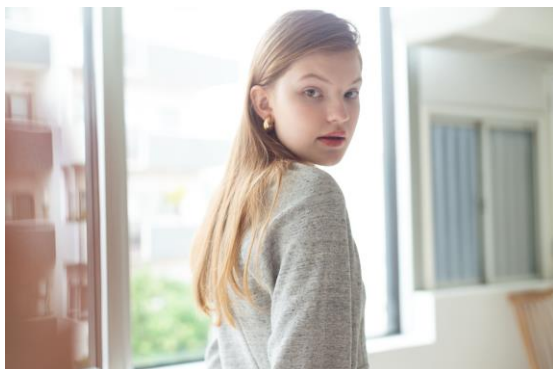
カジュアルダブルリボンワンピース ¥16.000+tax