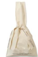
▲エコバックイメージ

オープン日の4月24日(金)から28日(火)の5日間限定で、1,000円以上お買い上げの方先着100名様にオリジナルデザインのエコバックをプレゼントいたします。手持ちでも肩掛けでもご利用可能なこだわりの2wayバックです。