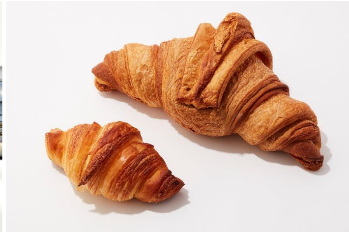
▲ビッククロワッサン

ベイクルーズグループの株式会社フレーバーワークス(本社:渋谷区渋谷1-23-21)が運営する、オリジナルブーランジェリー「BOUL' ANGE(ブル アンジュ)」は、北海道初出店となる「BOUL' ANGE 大同生命札幌ビル店」を4月24日(金)にグランドオープンします。