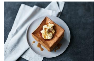
▲パンドミシフォン

昨年数量限定で発売し、即日即完売の人気商品「パンドミシフォン」が再登場。これまでにない“ひんやり”スイーツ感覚の食パンで、まるでシフォンケーキのように軽やかな食感が特徴。ちぎって“ふわふわ”食感を楽しむ、フルーツサンドやフレンチトーストにするなど様々なアレンジが可能です。