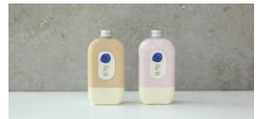
machi machi ボトルドリンク