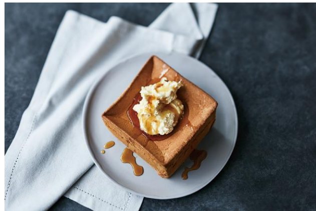
左) 内観イメージ、右) 「パンドミシフォン」イメージ

ベイクルーズグループの株式会社フレーバーワークス（本社：渋谷区渋谷1-21-23）が運営する、オリジナルブーランジェリー「BOUL'ANGE（ブールアンジュ）」は、「BOUL'ANGE 福岡大博多ビル店」を2020年10月2日（金）にグランドオープンします。