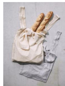
オリジナルエコバッグ

※ 1会計につき1点限り有効となります ※ お一人様1回限り有効となります ※ クロワッサンがなくなり次第終了