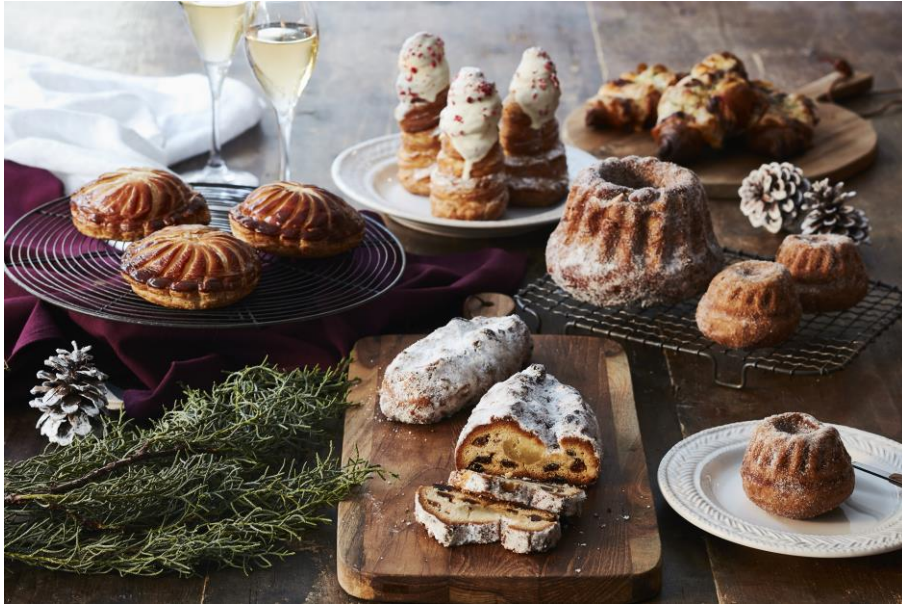
BOUL'ANGE 2020年クリスマスシーズン限定商品

ベイクルーズグループの株式会社フレーバーワークス（本社：渋谷区渋谷1-21-23）が運営する、オリジナルブーランジェリー「BOUL'ANGE（ブールアンジュ）」は、2020年のクリスマスシーズン限定商品を12月1日（火）より販売します。