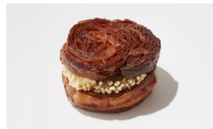
カフェ・オ・レクリームのカイニアアマンサンド ¥320

ダーズリンとスパイスで香り付した青森県産紅玉りんごとミルククリームをヴィエノワ生地でサンド。