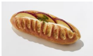
りんごとミルクのクリスマスヴィエノワ ¥320