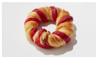
クリスマスリースデニッシュ ¥220

女性ファッション雑誌『FUDGE』 / 『FUDGE.jp』との初コラボレーションが実現。“おうちで楽しむクリスマス”をテーマに、両社に共通するフランスの要素や表現力を掛け合わせ、見た目にも味わいにも心ときめく商品が3種類登場します。