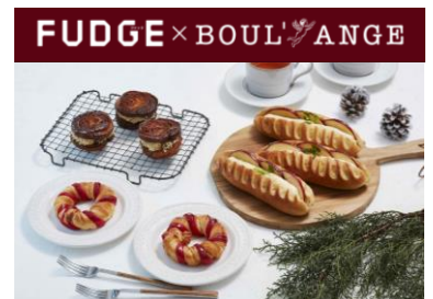
雑誌『FUDGE』 / 『FUDGE.jp』コラボレーション商品

なおコラボレーション含む一部商品は、オンラインショップ『BAYCREW'S FOOD MARCHE』でも展開。コロナ禍において外出が難しい方や、近隣に店舗がない方でもお取り寄せを通して、できたての美味しさをお楽しみいただけます。