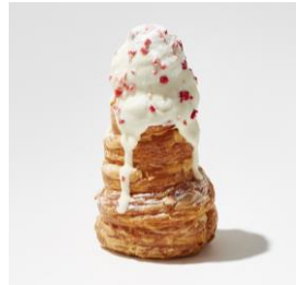
クリスマスモンブラン