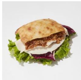
くるみソースのターキーサンド