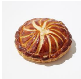
スモークターキーパイ

甘酸っぱいイチゴクリームを詰め、ホワイトチョコとドライストロベリーでクリスマスツリーのイメージに仕上げました。