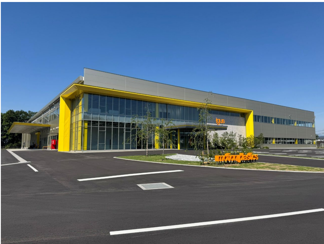
栃木さくら工場（栃木県さくら市）

イグス株式会社（東京都墨田区、本社ドイツ）は、日本市場での需要拡大を受け、供給体制のさらなる強化を図るため、栃木県さくら市に新工場「栃木さくら工場」を新設しました。同工場は 2026 年 6 月 22 日より稼働を開始しました。6 月初めに執り行った竣工式には約 50 名が参列し、工場の完成を祝いました。