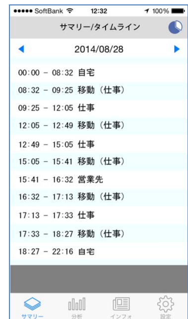
図3 タイムライン表示