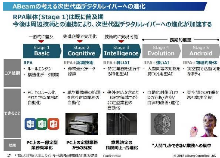
RPA の高度化のステップ

RPA と AI の連携によって、RPA で担える作業の拡大にも期待が集まっており、OCR 等を搭載する RPA Stage 2 に続き、個別の AI モデルを活用する RPA Stage 3 にも対応できるようになります。