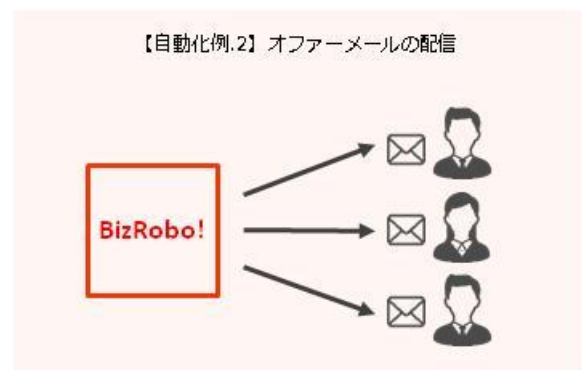
「採用業務代行サービス」