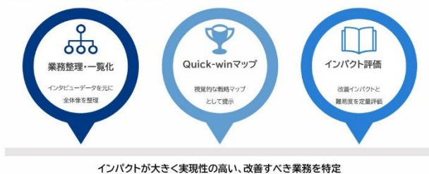
改善の優先順位をQuick-winマップで明確化

業務プロセスデータを AI が分析し、改善のインパクトと難易度を定量評価。視覚的な戦略マップ（Quick-win マップ）として提示します。これにより、インパクトが大きく実現性の高い改善対象を特定し、優先順位の合意形成を後押しします。