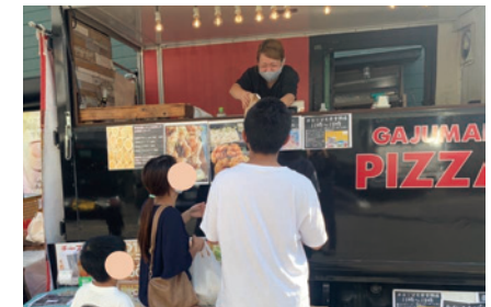
子ども食堂 withキッチンカー