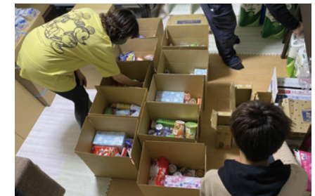
フードドライブ&パントリー