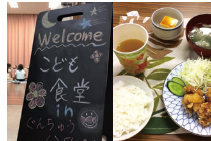
子ども食堂 (伊予市 生涯学習センターさざなみ館)

食糧支援の活動に関しては期間を限定して行う活動もありますので、現状を知りたい方は個別にお問い合わせください。