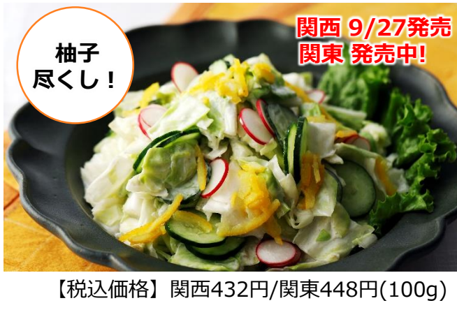
【税込価格】 関西432円/関東448円(100g)

金ごまとクラッシュアーモンドの香ばしい風味が特長のドレッシングで和えた季節のサラダ。ささがきごぼうとにんじんの食感、かぼちゃや、さつまいもの甘味が楽しめる女性に人気のサラダです。