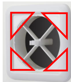
両面テープ付 (赤線部分)

「フィルタレット™ 空気清浄フィルター 給気口用」は、部屋の給気口に取り付けるだけで、給気口から侵入する花粉やPM2.5などの微粒子をキャッチし ※1 、部屋に入る空気を清浄化します。外から侵入する空気の汚れが気になる方、花粉症の方、家族の健康を気にする方などに最適です。