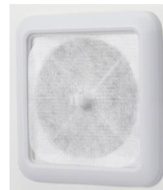
取り付けイメージ