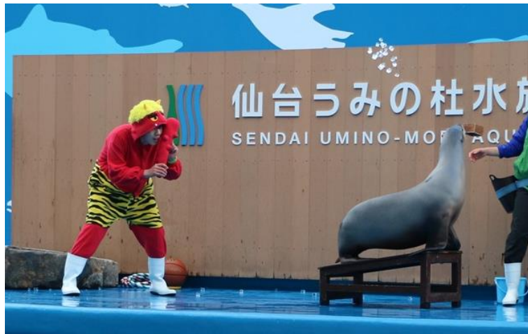
【 アシカの豆まき 】

「イルカ・アシカのパフォーマンス」内でアシカが豆まきを披露します。パフォーマンスを邪魔しようと「うみの杜スタジアム」に登場した鬼に向かって、豆に見立てた「氷」を撒いて鬼を追いかちます。さらにイルカの呼吸によって鬼のバルーンを膨らませるなど、節分期間限定のパフォーマンスをお楽しみいただけます。