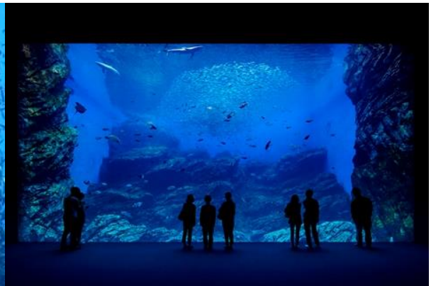
【 いのちきらめく うみ 】