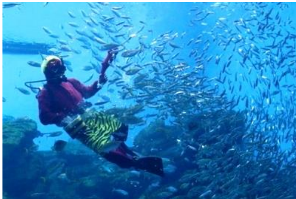
【 鬼ダイバー 】

幅14m、水深7.5mの大水槽「いのちきらめく うみ」に、鬼に扮したダイバーが登場します。大水槽に現れて暴れている鬼を退治するため、約2万尾のマイワシたちが大きな群れとなり、立ち向かいます。古くからマイワシは鬼の魔除けとして使われており、大水槽の平和のために大活躍なマイワシたちの様子をお楽しみいただけます。