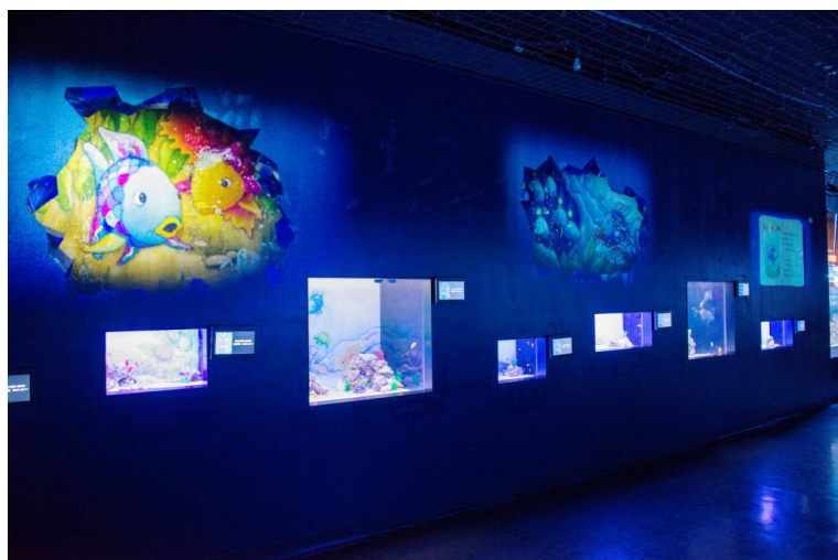
【壁一面に広がる9つの水槽群と映像演出】

水槽を覗き込んでストーリーを読んだり、名シーンを写真におさめたりと、美しい絵本の世界に浸りながら、色鮮やかな魚たちをご覧いただける“芸術の秋”にふさわしい企画展示です。