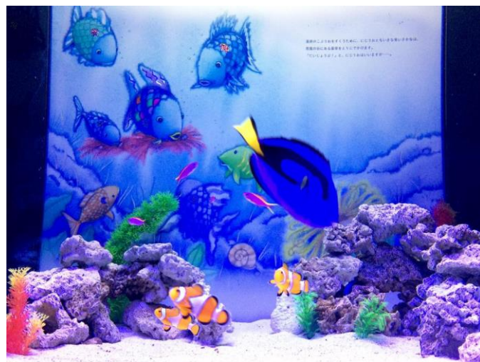
【絵本の名シーンが広がる水槽内】