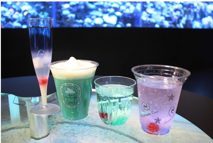
オリジナルドリンク4種 ※イメージ