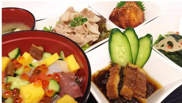
『シーストーリー』 あじさい御膳 1,680円(税込)

あじさい祭期間中、ベイマーケット各店やレストラン各店で「あじさいフェア」を開催いたします。あじさいをイメージしたメニューや、グッズ、あじさい鑑賞のお土産にぴったりなお菓子をご用意いたします。