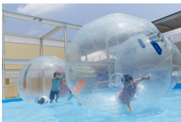
ウォーターバルーン