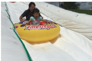
ホワイトマウンテン

プレジャーランドでも、期間限定で水を楽しむエリアが登場いたします。お子さまから大人の方まで楽しめる、巨大スライダーやウォーターバルーン、そして最近話題のスタンドアップパドルボード（SUP）などを気軽に体験することができます。昨年からさらにパワーアップしたウォーターアクティビティをお楽しみください。