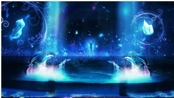
<青 神秘的な魔法の愛>

ナイトショー「LIGHTIA」は、青の世界、赤の世界、緑の世界、黄色の世界の4つの色鮮やかな世界の中で物語が進んでいきます。