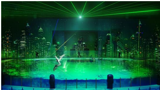
<緑 未来へと続く永遠の愛>