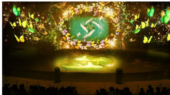
<黄 夢心地なやすらぎの愛>

青の世界ではイルカたちが魔法を繰り出し、トレーナーと力を合わせ、けがれの無い純粋な愛に満ちたクリスタルの神殿を作り上げます。赤の世界では伝説の神殿を目指してイルカが突き進み、情熱の赤い炎を灯します。緑の世界では光の魔法を解き放ち、イルカたちが躍動します。そして永遠の愛の力で未来の形を創造していきます。黄色の世界ではやすらぎの海の中でイルカとトレーナーが優雅に踊り、歌います。