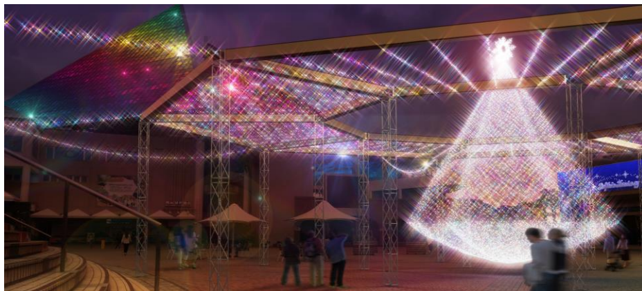
高さ8mのイルミネーション「プリリアント・ツリー」