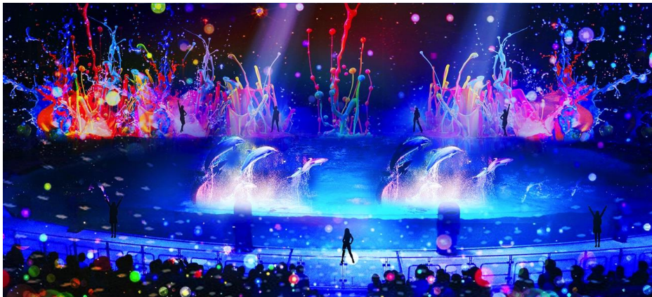
海の動物たちのショー「LIGHTIA」

そして、シーパラ全体を覆うほどの神秘的なイルミネーション空間が島内各所に登場。「アクアミュージアム」前の広場に高さ8mを超えるツリーと、幅2.4mの光のシャンデリアが一面を彩ります。