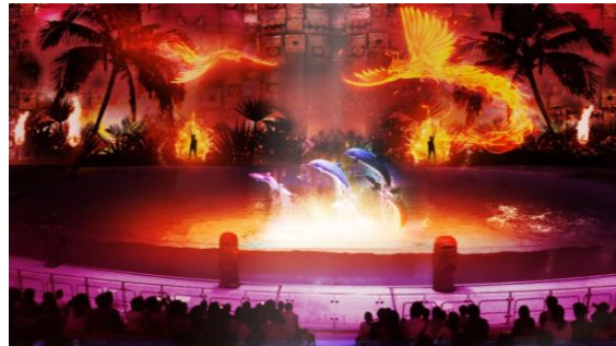
<赤 燃え上がる情熱の愛>