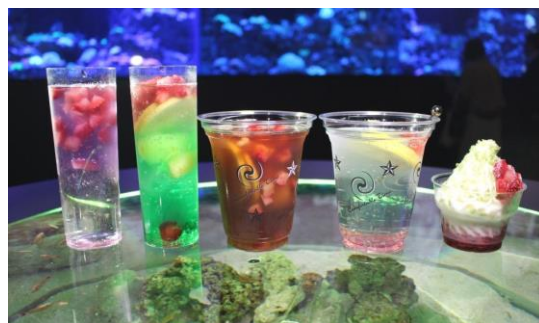
オリジナルメニュー5種 ※イメージ 【画像左より、①②③④⑤】