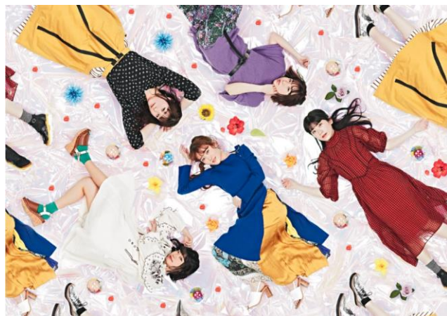
「Brand New Sea!!!!」 ※イメージ