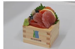
升盛りお刺身 （オリジナル升付き）