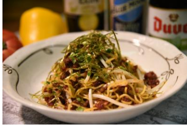
特製コンビーフ焼きそば