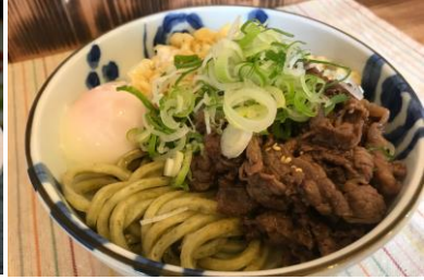
よろこんぶうどん