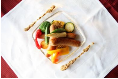
おひさまシイタケフランクのグリル

地元横浜金沢の名店をはじめ、金沢区の“食”が『横浜・八景島シーパラダイス』に集結いたします。ホテルシェフが地元素材を使用した「おひさまシイタケフランクのグリル」や金沢区名産品コンビーフがたっぷり入った「特製コンビーフ焼きそば」、地球温暖化を解決するために横浜の海で計画養殖されたこんぶを練り込んだ「よろこんぶうどん」、さらに14日（月・祝）限定で中央卸売市場と柴漁港がコラボする名物の「小柴の穴子丼」など、横浜金沢の食材やシーパラをテーマにした自慢フードの数々をお楽しみいただけます。