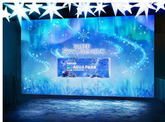
『BRIGHT SNOW』 ※イメージ

まるでクリスタルのように透きとおる体が美しい「イトヒキテンジクダイ」や「デバスズメダイ」が舞うように泳ぎ、ゲストをお出迎えします。プロジェクションマッピングによって水槽を囲む壁面にはオーロラがゆらめき、足元にはクリスタルが広がる、神秘的な冬を感じる空間です。さらに、壁に仕掛けたインタラクティブ映像で、ゲストが触れた場所から“雪の結晶”が浮かびあがる体感的な楽しみも創出し、この先に続く、「スノウアクアリウム」への期待感を高めます。