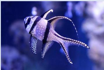
体のドットが雪のように見える 「プテラポゴン・カウデルニ」