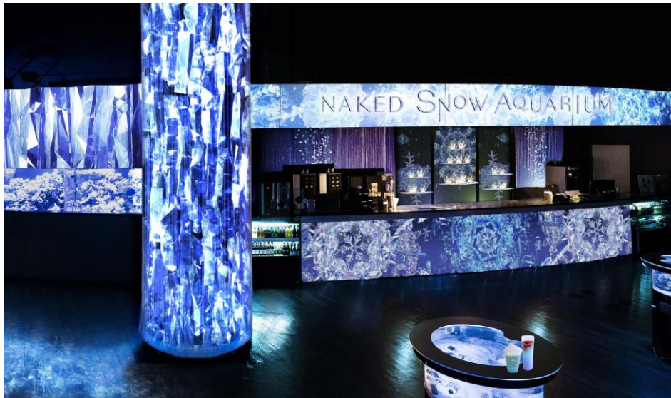
『CRYSTAL BAR』 ※イメージ

メニューには「スノウアクアリウム」をイメージした、色合いの美しい限定ドリンクをご用意し、映像の仕掛けで雪の結晶やダイヤモンドダストがきらめくバーカウンターにて提供します。