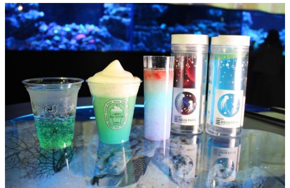
『NAKED SNOW AQUARIUM限定ドリンク』

◆スーベニアボトルは、当館の「ジェリーフィッシュランブル」をイメージしたオリジナルタンブラーです。 お召しあがり後は、おみやげとしてお持ち帰りいただけます。