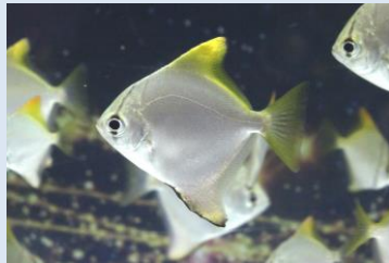
白銀の体色を持つ 「ヒメツバメウオ」