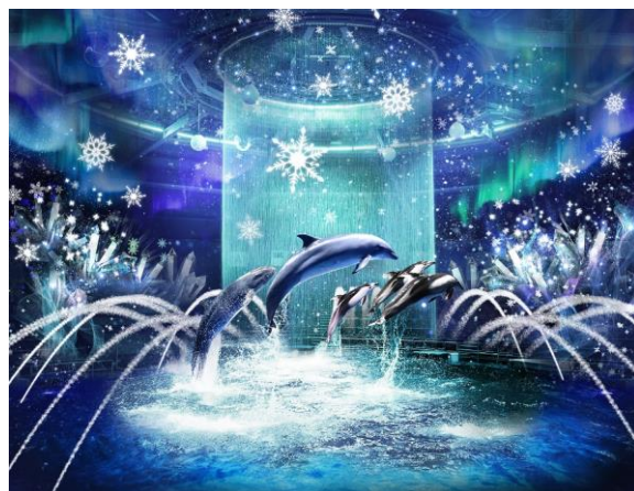
『BRIGHT CRYSTAL』 ※イメージ

夜は【水(噴水、ウォーターカーテン)】・【光(ムービングライト、水中照明)】・【映像(プロジェクションマッピング)】・【音(12.1chサラウンド)】などの最先端技術を用いて描いた、幻想的な冬景色が舞台。クリスタルやオーロラが会場全体をつつみ込み、“スノウマシン”による雪降る演出の中、イルカとトレーナーが魅せる静かなダンスパフォーマンスや、跳ねあがる水しぶきさえも美しい、力強い全頭ジャンプなど、華麗な技の数々を披露します。