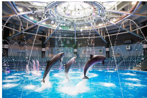
『WINTER JOURNEY』 ※イメージ

「ザ スタジアム」の天井から降り注ぐ自然光とウォーターカーテン、噴水が調和した、きらめきを放つ舞台上でイルカたちが音楽に合わせて、躍動的なパフォーマンスをお届けします。“さまざまな冬への旅”をテーマに、ダイナミックなジャンプや美しいダンスパフォーマンスで、厳しい吹雪や穏やかに舞う雪の様子などを表現。後半にはトレーナーの衣装もチェンジし、場面転換を際立たせます。Day ver.ならではの“ゲスト参加型”の要素を取り入れることで、イルカ、トレーナーそしてゲストがひとつになり、“冬をめぐる旅”をお楽しみいただけます。