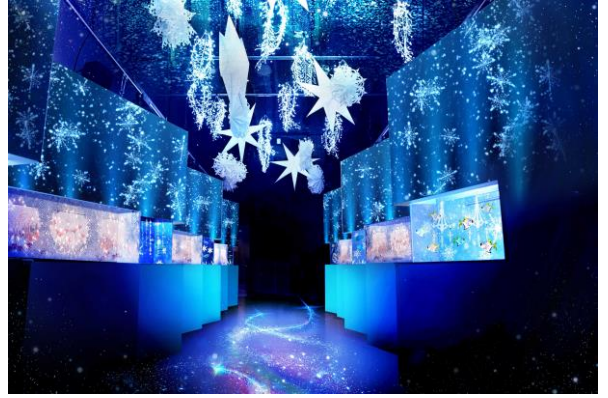
『WINTER COLOR STREET』 ※イメージ

歩を進めながら、1つ1つの水槽内にも広がる、小さな「スノウアクアリウム」の世界をお楽しみいただけます。