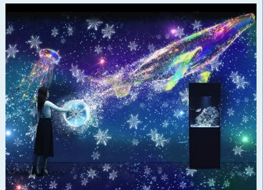
「インタラクション」 ※イメージ

生きもののバリエーションは【シードラゴン、カメ、エイ、イカ、エビ、イワシ、クラゲ、クジラ】の8種類。それらがランダムに出現したり、全長8mにも及ぶ“クジラ”だけは出現率を低くしたりと、何度でもお楽しみいただけるように遊び心を持たせました。ゲストがバブルに触れ、七色の生きものを登場させることで空間に彩りが加わり、より美しい“海のスノウドーム”へと進化します。