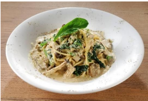
「ポルチーニ茸と4種きのこのクリームパスタ」 料金：1,280円 場所：マンジャーレ

島内のレストランや軽飲食店舗では、食欲の秋にぴったりなメニューをご用意いたします。さまざまな種類のキノコがたっぷり入ったクリームパスタや、ゴロツと大きなお肉と野菜が入ったビーフカレーなど、香りも味も楽しめるメニューが盛りだくさんです。そのほか、サツマイモやカボチャといった秋の味覚を楽しめる甘いスイーツなども登場いたします。