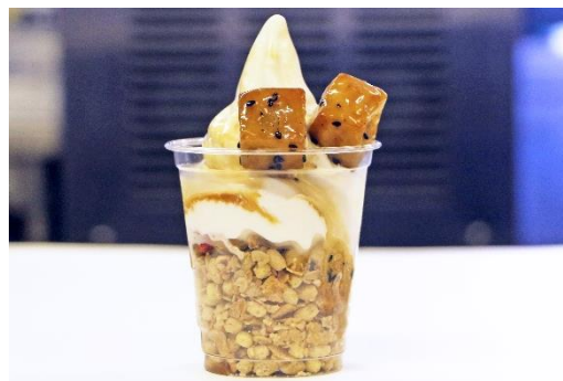
「黒蜜サンデー」 料金：450円 場所：ドルフィン