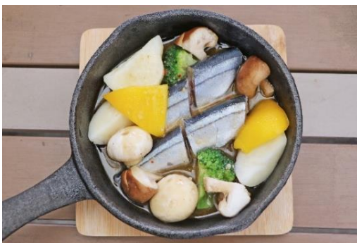
「さんまときのこのアヒージョ」 料金：990円 場所：Seafood & Grill YAKIYA