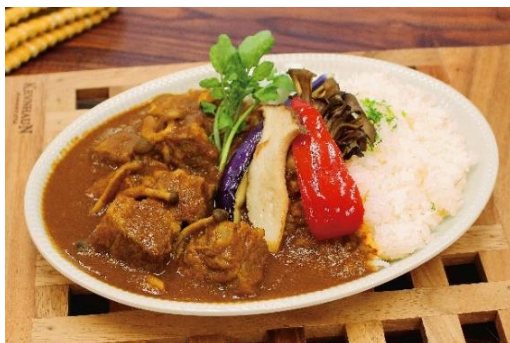
「和牛の欧風カレーライス」 料金：980円 場所：コバラカフェ