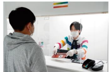
アクリルパネルの設置