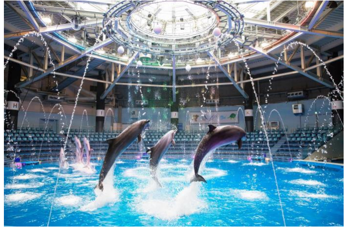
「Sky Symphony ※イメージ」

さらに、プログラム構成には“新しい生活様式”からヒントを得た2つのノンバーバル要素「①サイレントタイム」「②ゲスト参加型」を織り込み、MC や楽曲を入れない無音の空間で感じるイルカたちの“躍動感”や、会場一体となって盛りあがる演出で、ゲストに【熱い興奮】を感じていただけるパフォーマンスが完成しました。