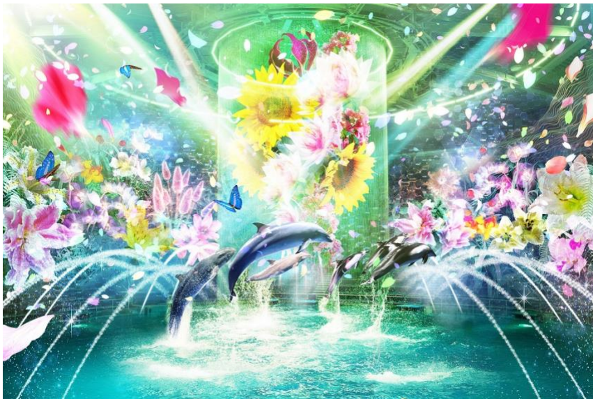
「Beauty of Flower ※イメージ」

【4月24日(土)～6月27日(日)※5月1日(土)～5日(水)を除く】19:00 ※6月13日(日)は貸し切り営業のため、実施いたしません。 【5月1日(土)～5日(水)】19:30