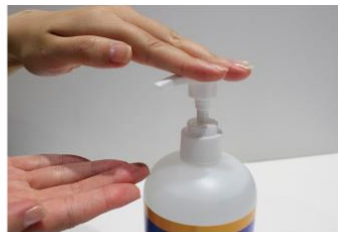
アルコール消毒液の設置