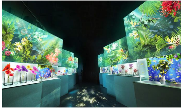
「Blooming Street ※イメージ」

花の造作と水槽が交互に並ぶ“アトリウム”のようなエリアです。壁や床にも映像演出が施され、空間全体で「フラワーアクアリウム」をお楽しみいただけます。こちらでは7つの水槽ごとに愛や幸せあふれる“花言葉”と、その植物の名前にちなんだ生きものを展示。例えば黄色の体色が鮮やかな“レモンテトラ”の水槽は、“誠実な愛”の花言葉を持つレモンの花の装飾とともに楽しめます。1つ1つをのぞき込みながら言葉にふれていただくことで、ゲストに【前向きな気持ち】をもたらします。