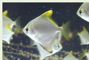
■名前に“ツバメ”が含まれる「ヒメツバメウオ」