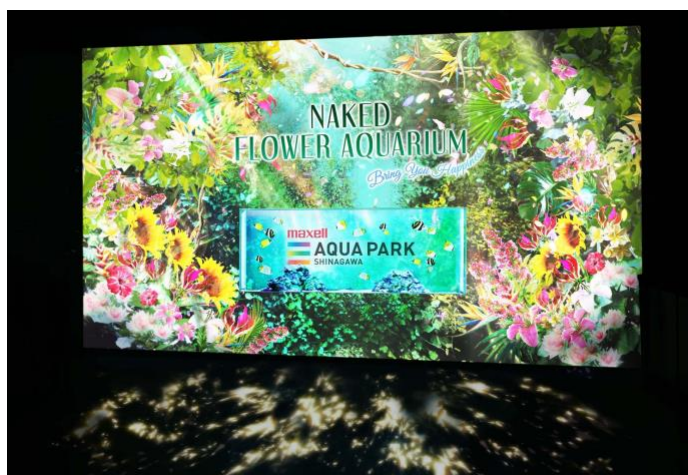
「Welcome Flower Gate ※イメージ」

色鮮やかなデジタルアートの花々と緑に覆われた、華やかなエントランス。中央の水槽には「トゲチョウチョウオ」や「ハタタテダイ」がまるで“蝶”のように舞泳ぎ、ゲストの来訪を歓迎します。さらに、足元には木漏れ日の映像が優しく揺れ、体感的にお楽しみいただくことで、これから始まる「フラワーアクアリウム」への【ワクワク感(=期待感)】を高めます。