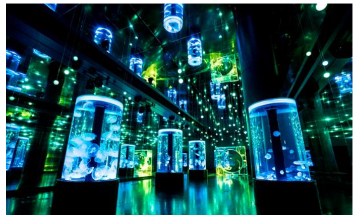
「ジェリーフィッシュランブル ※イメージ」

7つの円柱水槽と全面がクリスタルのシンボリックな水槽が並ぶ、クラゲ展示の大空間。生きものの魅力を引き立てる水槽照明と、98個のLEDライトが音楽に連動して輝き、鏡面になっている天井や両壁に反射して無数の光がエリア全体に広がります。今回は晴れ渡る初夏の空や、新緑をイメージしたブルーとグリーンが基調のライティングで3分毎に季節演出を開催。うっとり【恍惚感】を感じる、幻想的な光景がお楽しみいただけます。