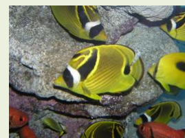
■英名に“Raccoon(=アライグマ)”が含まれる「チョウハン」