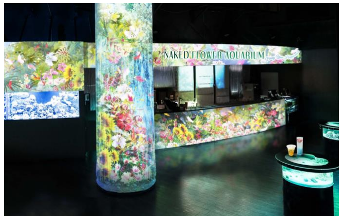
「Floral Cafe Bar ※イメージ」

海中に咲く「花」のような発光サンゴの水槽と、色彩豊かな映像の「花」が共演する美しいカフェバーでは、イベントと連動したオリジナルメニューをご用意しています。初夏の爽やかさや植物の色合いをイメージし、可憐な花々の名前がついたドリンクとスイーツは全部で5種類。なお、ご購入いただいた商品は館内での持ち歩きも可能です。