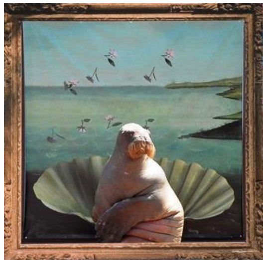
ヴィーナスの誕生

時 間 ： 平 日 14:20 土休日 11:30、14:20 (約5分間) 場 所 ： ふれあいラグーン