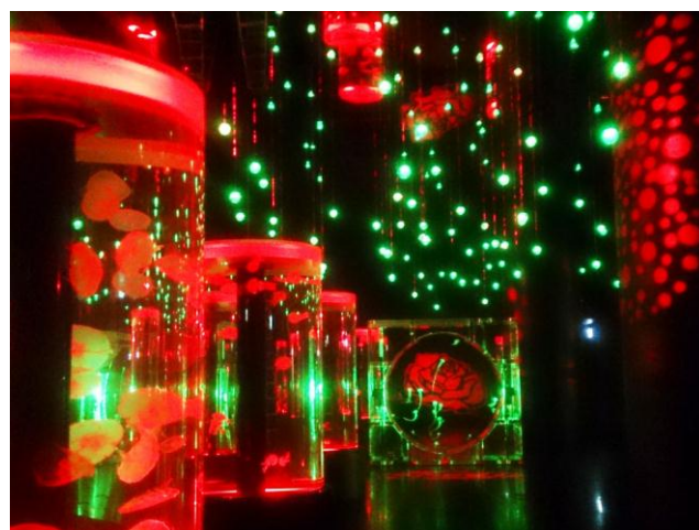
クラゲ展示の大空間「ジェリーフィッシュランブル」（左：デイ ver. / 右：ナイト ver.）