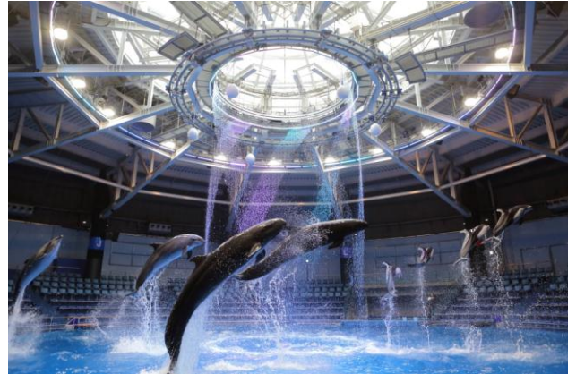
デイパフォーマンス（空間イメージ）

天窓からの自然光がウォーターカーテンに差しこみ、水がきらめく明るい空間の中で繰り広げられるパフォーマンスのテーマは、イルカと、魔女やモンスターの衣装をしたトレーナーたちがホストとなってお届けする「ハロウィーンパーティー」。“ジャック・オー・ランタン”や“コウモリ”などのシルエットを刻むウォーターカーテンで雰囲気を高め、ゲストのお客さまには“スプラッシュ”コーナーで水しぶきのいたづらを。会場一体となってお楽しみいただける、とびきりのパーティータイムです。