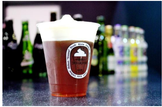
キリン一番搾りフロズン ハロウィーンカクテル