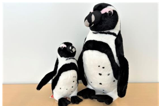
ケープペンギン“ふゆ”のぬいぐるみ (S. M) Sサイズ ¥1,980 (税込) / Mサイズ ¥3,980 (税込)

1階のミュージアムショップ「umimori shop」では、もっとペンギンを好きになるオリジナルペンギングッズを販売いたします。当館の末っ子ケープペンギン“ふゆ”をモデルに、細部までこだわった「ケープペンギン“ふゆ”のぬいぐるみ」、必ずぬいぐるみが当たる大人気くじのオリジナルバージョン「ハッピーペンギンくじ」が登場！