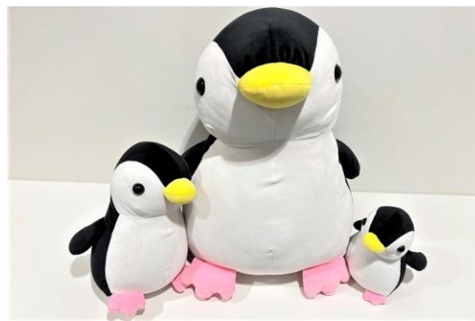
ハッピーペンギンくじ ¥1,500/回 (税込)