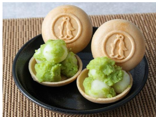
ペンギンもなかサンド 2個 ¥580 (税込)