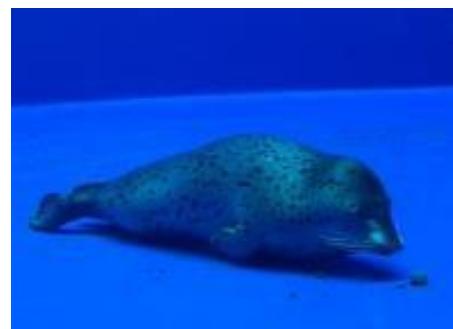
イルカやアザラシの眠り方の違いを観察