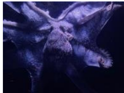
活発に動く夜行性のミズダコ