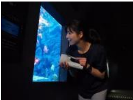
懐中電灯で館内を探検

さらに、「DEEPナイト」にぴったりの限定イベント「DEEPトーク」、「DEEPラボ」で、DEEPな夜をお過ごしいただけます。