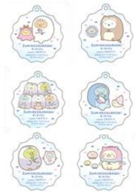
アクリルキーホルダー