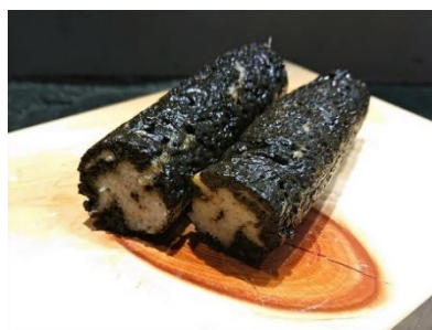
カナガシラで作った恵方巻

アナゴにプレゼントする恵方巻は、長崎県で節分に食べる風習がある「カナガシラ」という魚をすり身にし、イカ墨を加え、筒型に固めて海苔巻きを再現しました。大きな口を開けて、恵方巻に食いつくアナゴたちの活発な姿をご覧ください。