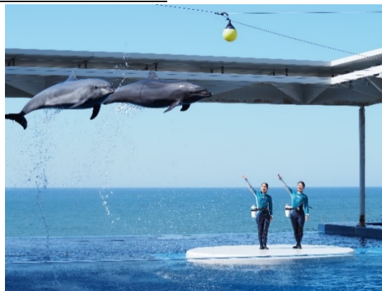
上越市立水族博物館 うみがたり