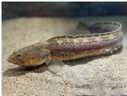
【上越市立水族博物館 うみがたり】 ナガツカ