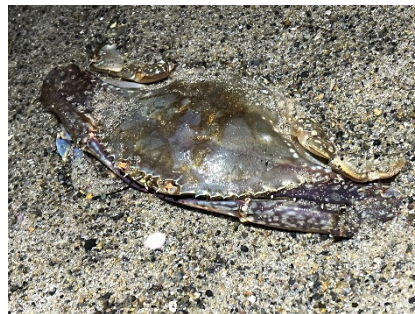
【仙台うみの杜水族館】 ガザミ