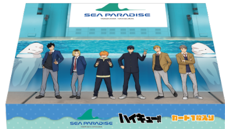
【横浜・八景島シーパラダイス】 プリントクッキー 料金：1,620 円 (税込)