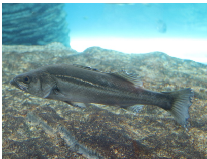
【横浜・八景島シーパラダイス】 スズキ

『横浜・八景島シーパラダイス』の“スズキ”、『上越市立水族博物館 うみがたり』の“ナガツカ”、『仙台うみの杜水族館』の“ガザミ”が並び、各水族館のイベント期間中にご覧いただくことができます。