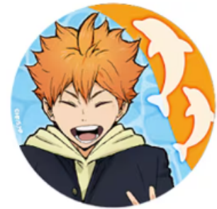
【ノベルティ】 BIG缶バッジ