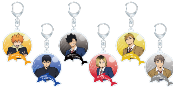
【施設共通】 アクリルキーホルダー 料金：1 個 550 円 (税込)

本イベント限定の描き下ろしビジュアルを使用したオリジナルグッズの販売が決定！対象店舗でオリジナルグッズを 2,000 円 (税込) ご購入ごとに「オリジナルカード (全 6 種)」をランダムで 1 枚プレゼントいたします。また、各水族館のオリジナルコラボフードもご用意！ぜひご賞味ください。