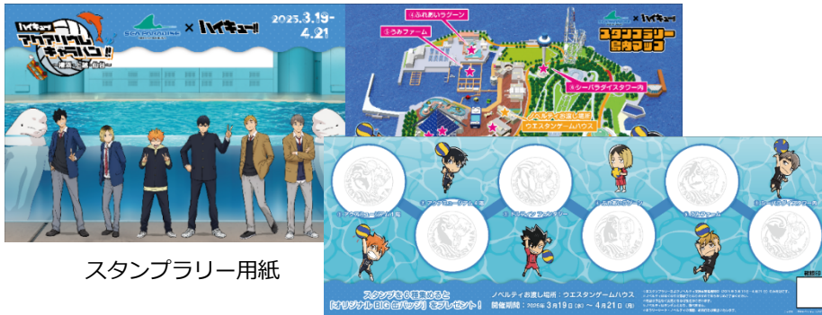
スタンプラリー用紙

各水族館でオリジナルスタンプラリーを開催！計 6 か所のスタンプを集めると、BIG 缶バッジ (全 6 種) をランダムで 1 種プレゼント。水族館コラボならではのスタンプデザインにもご注目ください。