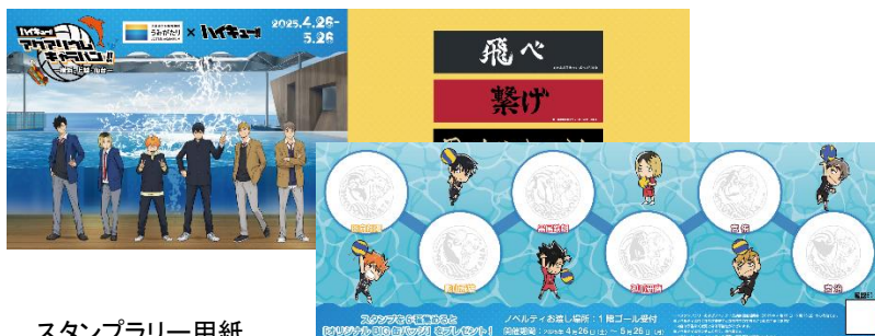
スタンプラリー用紙

館内を巡りながらアニメ「ハイキュー!!」のキャラクターが描かれたスタンプを集めるオリジナルスタンプラリーを開催！計6か所のスタンプを集めると、BIG缶バッジ（全6種）をランダムで1種プレゼントします。水族館コラボならではのスタンプデザインにもぜひご注目ください。