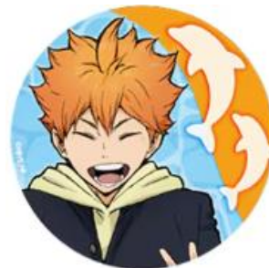
【ノベルティ】 BIG缶バッジ