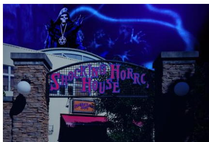
ショッキングホラーハウス