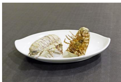
【オオグソクムシ 姿揚げ】

料 金：タカアシガニ（特大サイズ）1杯 13,000円 タカアシガニ（中サイズ）1杯 6,500円 調理方法：塩焼き 販売場所：うみファーム 調理場所：Seafood & Grill YAKIYA