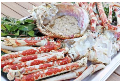
【タカアシガニの塩焼き】

深海生物であるタカアシガニやオオグソクムシを実際に食べることができるイベントを期間限定で開催いたします。カニ味噌がたっぷりつまったタカアシガニや、見た目からは想像がつかない食感のオオグソクムシはそのままの姿でお召しあがりいただけます。未知の味である深海生物。一体どのような味なのか、ぜひお確かめください。