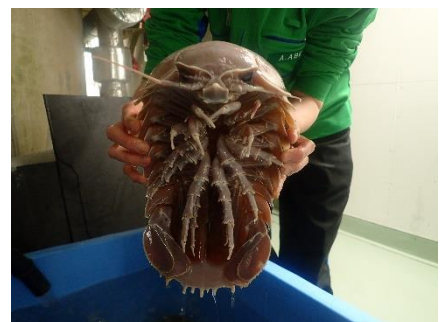
ダイオウグソクムシ