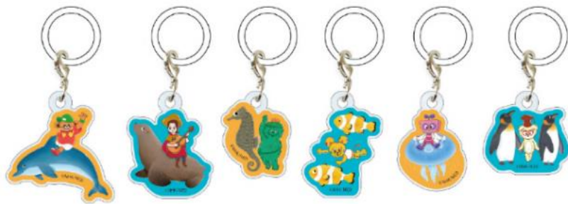
めじるしアクリルチャーム (ランダム全6種) 570 円 (税込)