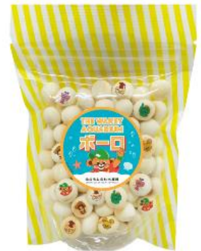
プリントポーロ 660 円 (税込)