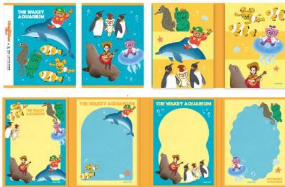
パタパタメモ 770 円 (税込)