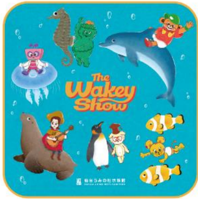
ハンドタオル 880 円 (税込)

本企画のメインビジュアルを使用した、オリジナルコラボグッズを多数販売いたします。 コラボグッズの他にも、The Wakey Show グッズを販売いたします。