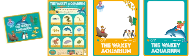
<生きもの探しカード>