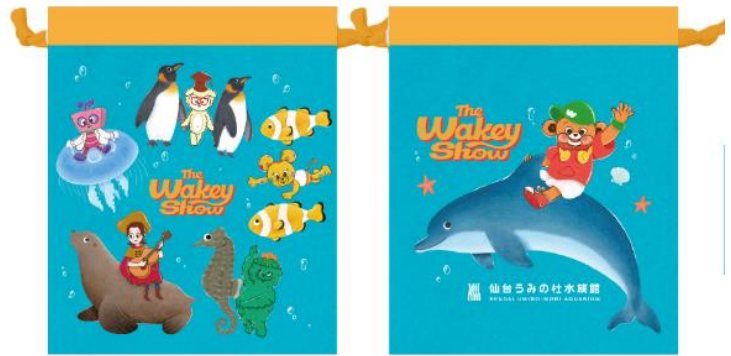
巾着 1,430 円 (税込)